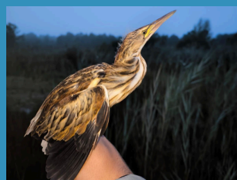
Observation du Blongios nain